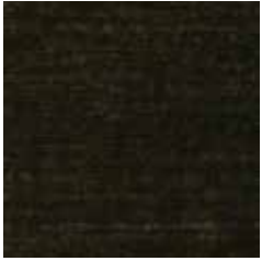
UL 03-01 Schwarz