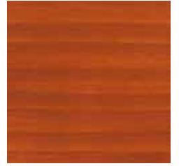
UL 02-05 Mahagoni