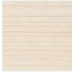
UL 03-08 Kalkweiß