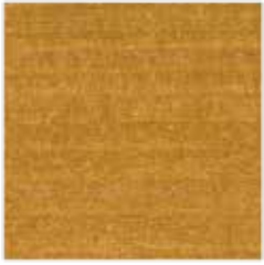
UL 04-06 Eiche