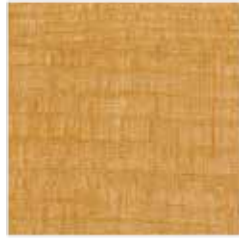
UL 04-07 Pinie